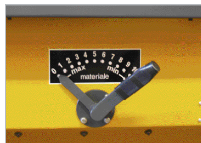
Doseringsskala för ändring av utlagd mängd.