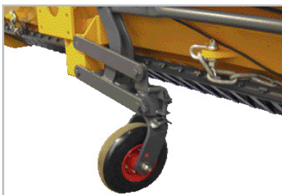
Justerbart stödhjul för avställning. Enkel på och avmontering av spridaren.

Datauppsamling: Möjlighet för montering av Epo Link datauppsamlingsbox för överföring av spridningsdata till Vinterman Light.